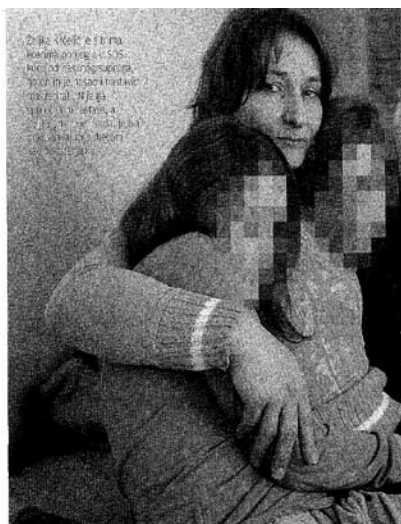
AGONIJA ZLOSTAVLJANE ŽENE I na tajnoj adresi strepim

Nerijetko se događa da novinari ne navode imena žrtava, ali zato navode cijeli niz specifičnih detalja po kojima osobe iz bliže ili dalje okoline mogu prepoznati žrtve. Primjer ovakvog izvještavanja je tekst s ispoviješću jedne majke. Identitet djece se ne otkriva, ali iz članka saznajemo da je riječ o djevojčicama koje su odlikašice, treniraju karate, imaju crni pojas... U istom članku, međutim, identitet zlostavljača ostaje zaštićen, ne spominje mu se ime, a fotografija je zamučena. S pravom se postavlja pitanje što ovog zlostavljača čini drukčijim i zaštićenijim od javnih osoba koje su u medijima prikazane kao zlostavljači, nerijetko i prije no što je slučaj detaljno provjeren.