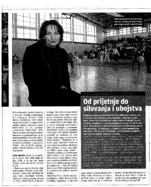
Od prijetnje do silovanja i ubojstva